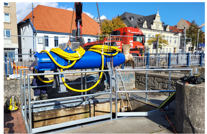
Einbau der Pumpe beim Siel und Mündungsschöpfwerk

Während des Weihnachtshochwassers war bei dem 1980 erbauten Siel und Mündungsschöpfwerk eine Pumpe ausgefallen. Diese wurde geborgen und instandgesetzt. Ebenso wurden sämtliche Einbauteile der Pumpenkammer ausgebaut und generalüberholt.