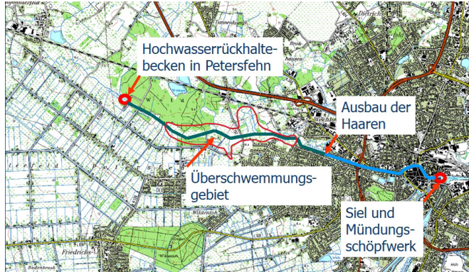
Hochwasseranlagen der Haaren-Wasseracht

Das Weihnachtshochwasser 2023 hat in vielen Regionen erhebliche Schäden an den Hochwasseranlagen verursacht. Dies galt auch für die Anlagen der Haaren-Wasseracht.